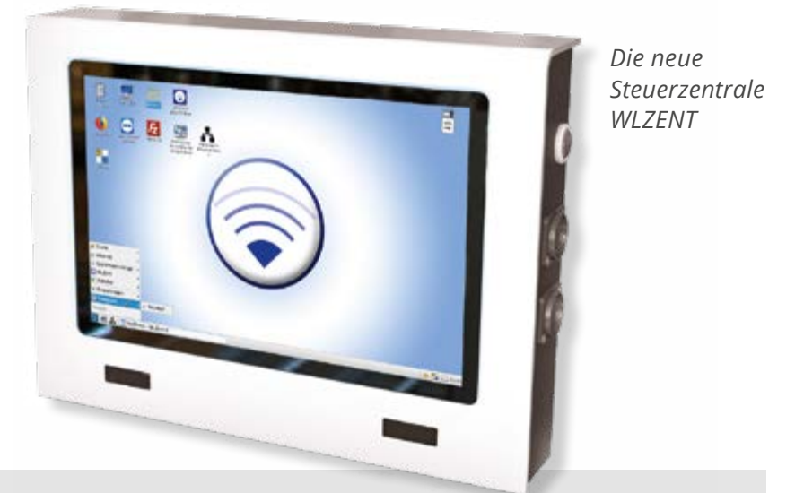
Die neue Steuerzentrale WLZENT