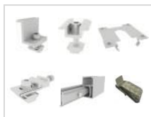
SET A1 Support pour 4 panneaux, 30mm épaisseur de cadre, argent