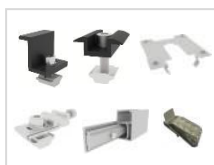
SET A2 Support pour 4 panneaux, 30mm épaisseur de cadre, noir