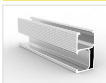
SET C1 Rail aluminium 2350mm, argent