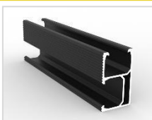
SET C2 Rail aluminium 2350mm, noir