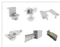
SET A3 Support PV pour 4 panneaux, épaisseur de cadre 35 mm, argent