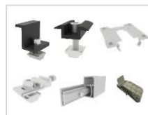
SET A2 Support PV pour 4 panneaux, 30mm épaisseur de cadre, noir