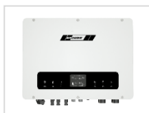
ONDULEUR - HYBRID PV-HYWR-10KW-3P-02-WIFI